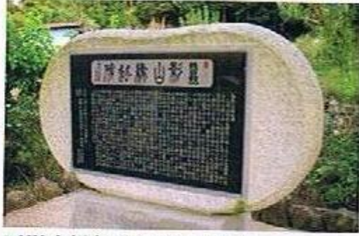
蚕影山縁起碑（多胡・龍源寺）